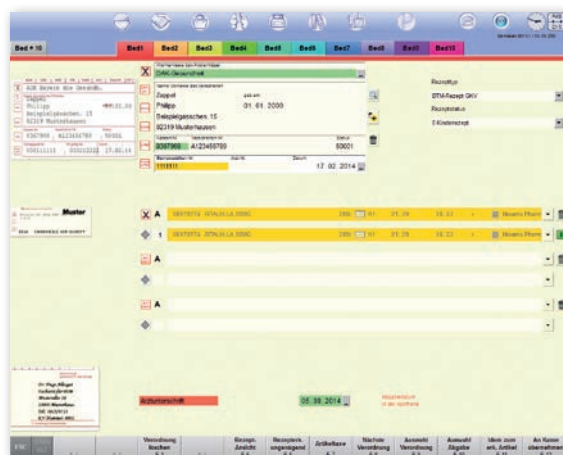
Automatische Prüfung der Arztunterschrift