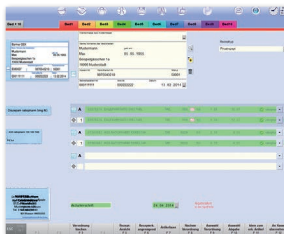
Für alle Rezeptarten geeignet: GKV, BtM, Grünes und Privatzept