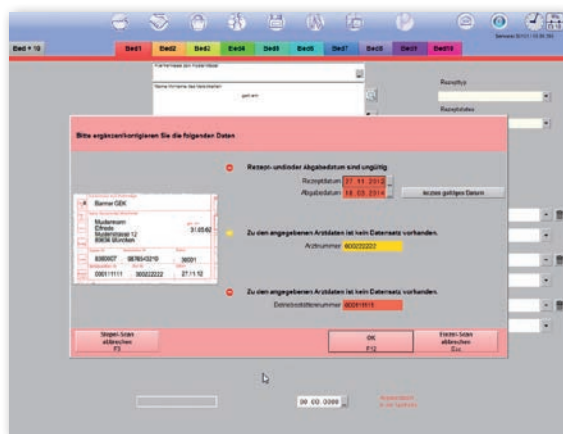
Automatische Überprüfung, z. B. des Rezeptdatums

Intessenten Kontakt: 08151 55 09 219 Kundensupport Hotline: 08151 55 09 295