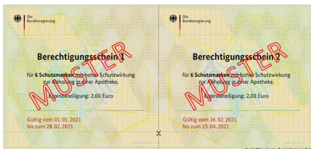
Abbildung 1- Bezugsschein 1 und 2

Die Bezugsscheine müssen in der Apotheke mit Stempel, Abgabedatum und Mitarbeiterunterschrift bis zum 31.12.2024 aufbewahrt werden.