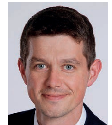
Dr. Christian Ude