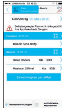
Automatische Risikoüberprüfung Ihrer Medikamente