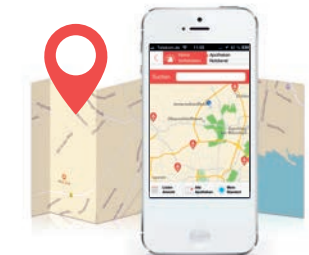
Der Apothekenfinder zeigt die nächstgelegene Apotheke an