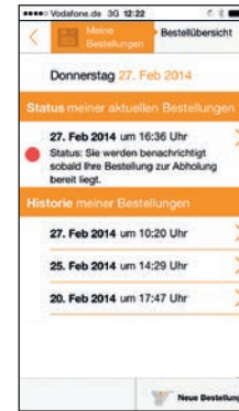
Statusübersicht der aktuellen Bestellungen

nerungsfunktion wird Ihnen die pünktliche Einnahme angezeigt.