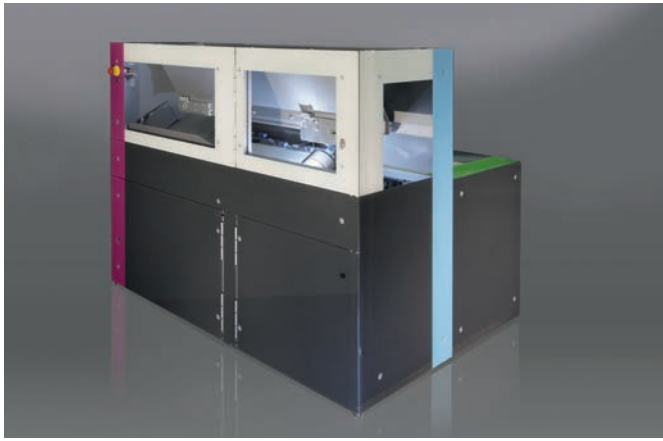
K2-m vollautomatische Einlagerung