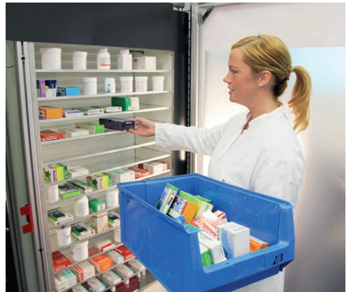
Platzsparend – die praktische K2-m Einlagerungstür

Packungen werden einfach auf die Fachböden der Einlagerungstür abgelegt, dabei können auch mehrere Packungen hintereinander gelegt werden. Nach Schließen der Tür werden diese vollautomatisch eingelagert, natürlich auch wenn Ihre Apotheke längst geschlossen hat.