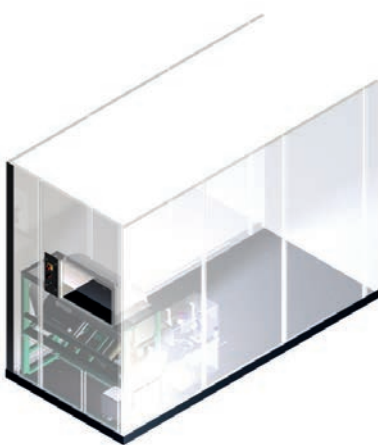
Virtuelle Sicht Einlagerung 1