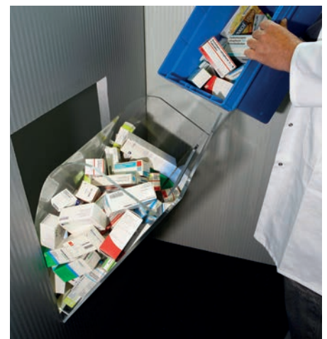
Befüllung der Medikamente